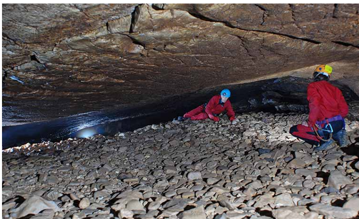
Nappe de galets dans les conduits épinoyés du système de Foussoubie en Ardèche.

L'environnement karstique est connu pour ses qualités d'enregistreur privilégié des informations paléoenvironnementales. Les niveaux étagés se raccordent aux terrasses fluviales et les morphologies de conduits héritées, marquant les paléo-altitudes des surfaces piézométriques, sont autant d'éléments calant les positions successives du niveau de base. Ces morphologies permettent de reconstituer des environnements paléogéographiques, des évolutions, des rythmes de surrection et d'incision des vallées. Les